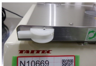
左側 固定ノブあり