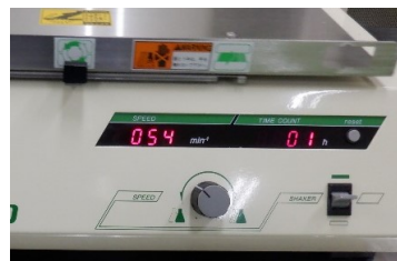
経過時間 : 0.1Hr